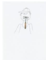
IRONIMUS , Metamorphosen, Nr. 10, 2015