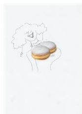
IRONIMUS , Metamorphosen, Nr. 32, 2016