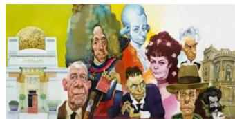
Erich Sokol, Wiener Festwochen, 1986