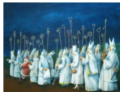
Pavel Matuška, Krücke, Krücken, Krücklein, 2008 © Pavel Matuška