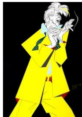
Josef Blecha, David Bowie, 2015