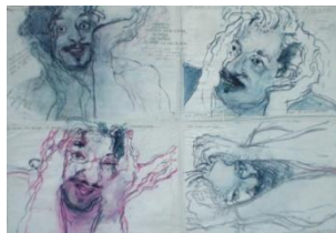
Thomas Spitzer, Selbstporträt, 2001 © Thomas Spitzer