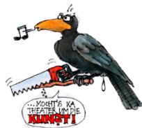
Thomas Spitzer, Pfeif drauf!, 2017 © Thomas Spitzer