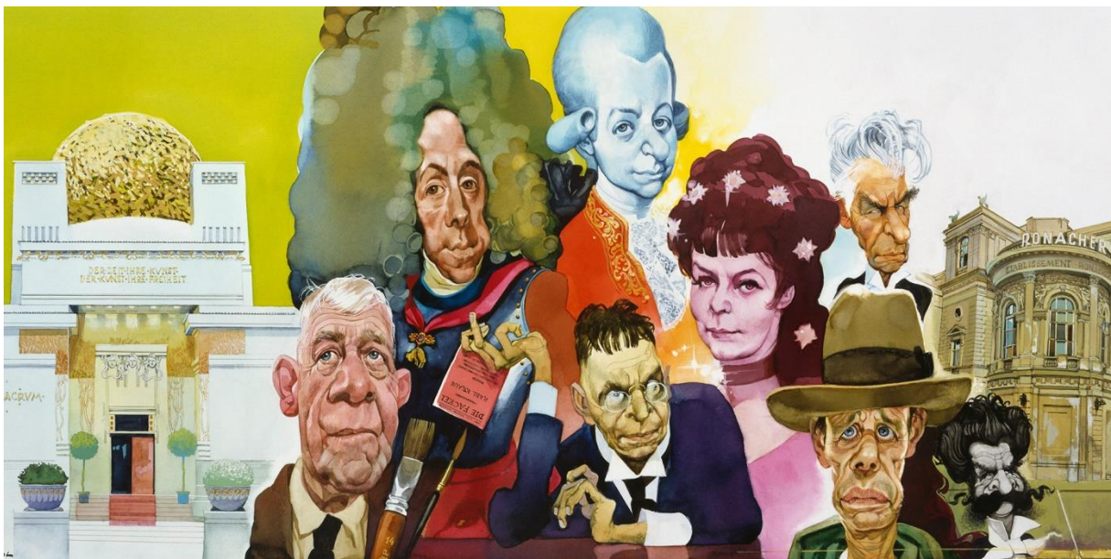
Erich Sokol, Wiener Festwochen, 1986