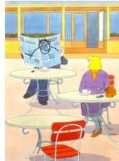
Miroslav Bartak, Kavarna, o. D. © Miroslav Bartak