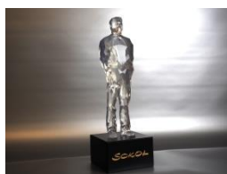
Der SOKOL © OMC Design/Stangl, 2017