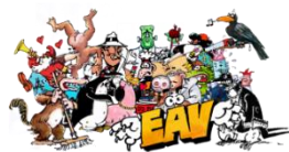
Thomas Spitzer, Collage EAV, 2017