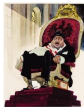
Erich Sokol, Der Herr Doctor Karl, 1987 © Erich Sokol Privatstiftung Mödling