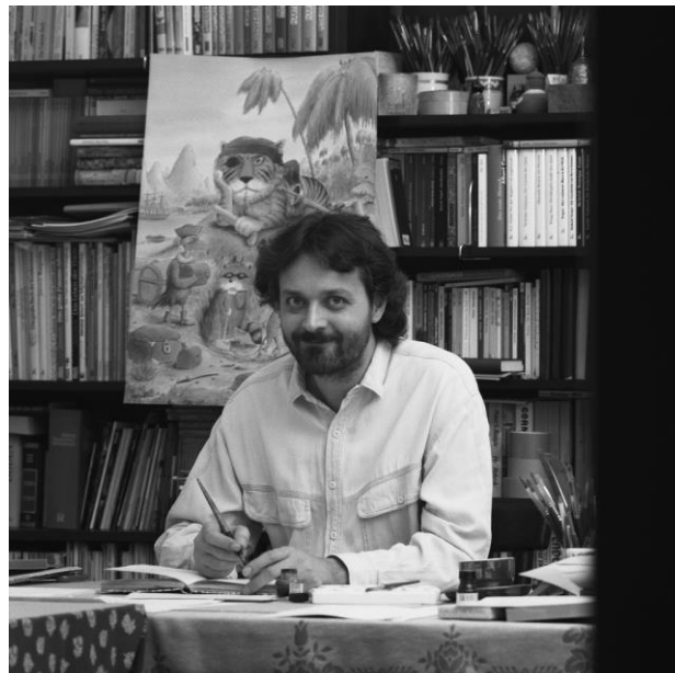
Erwin Moser

2014 öffnete das Erwin Moser Museum in Gols, der Heimatgemeinde des Künstlers. 2017 verstarb Erwin Moser. Zwei Jahre später wurde die Golser Volksschule in Erwin Moser Volksschule umbenannt.