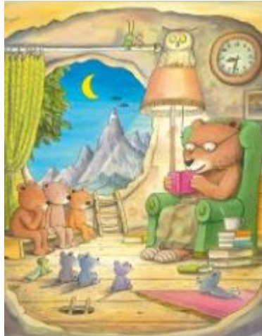
Erwin Moser, Großvater Bär, 1994 © Beltz & Gelberg