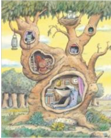
Erwin Moser, Gute Nachbarn, 1993 © Beltz & Gelberg