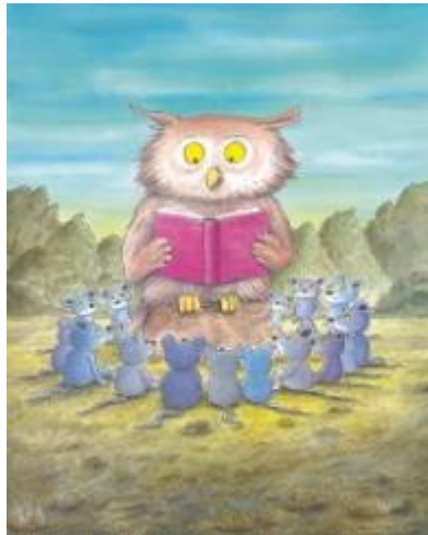
Erwin Moser, Die Mäuse und der Uhu, 1994 © Beltz & Gelberg