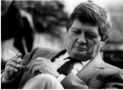
Erich Sokol © Annemarie Sokol