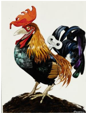
Erich Sokol, Wenn der Hahn kräht... müssen Millionen Österreicher um eine Stunde früher aufstehen - die Sommerzeit ist gekommen, 1980

Das Porträt von Gerd Bacher verbunden mit dem Körper eines Tigers erinnert in „Der Tiger hat Appetit“ an den Abschied des langjährigen Generalintendanten des ORF. Das sogenannte Wunder von Córdoba ist in „Weltmeisterschaft in Argentinien“ mit Herbert Prohaska, Hans Krankl und Bruno Pezzey festgehalten. Zahlreiche satirische Porträts stellen Sokols Meisterschaft als Porträtist unter Beweis. Dabei gelingt es ihm, den Widerspruch von Ideal und Wirklichkeit aufzudecken und Verborgenes zu enthüllen. So etwa die Cartoons von Elisabeth II. zu ihrem 25-jährigen Thronjubiläum und von der österreichischen Film-Diva Paula Wessely. Ein wiederkehrendes Thema in Sokols Cartoons für die Neue Kronen Zeitung ist die Frage nach der österreichischen Identität. In diesem Zusammenhang entwickelte der Künstler die Figur des Herrn Strudl, der für den typischen Österreicher steht und in zahlreichen Cartoons auftritt.