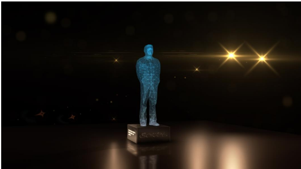
Erich-Sokol-Preis © Kunstmeile Krems

Die weiteren Preisträger:innen werden im Rahmen der SOKOL-Preisverleihung am 10. März veröffentlicht und gemeinsam mit Scarfe geehrt.