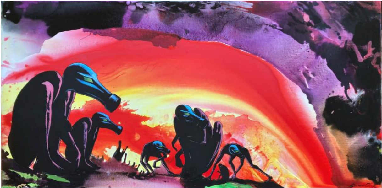
Gerald Scarfe, The frightened ones, 2021 © Gerald Scarfe

Eröffnung: Freitag, 10.03.2023, 19.00 Uhr