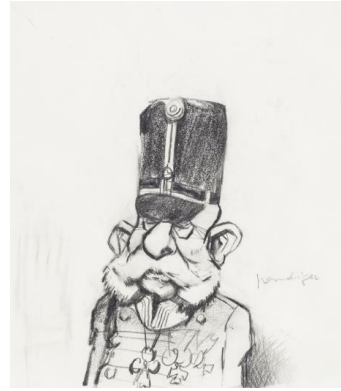
Erich Sokol, Skizze zu: Kaiser Franz Josef, 1980