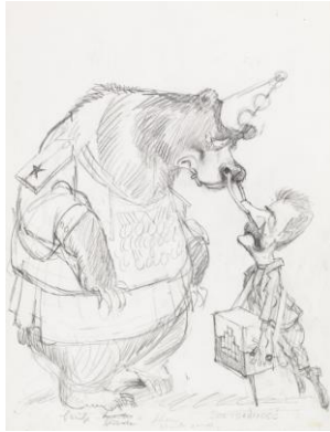
Erich Sokol, Skizze zu: Polnische Dompteurnummer, 1981 © Annemarie Sokol/Landessammlungen NÖ