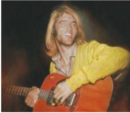
Sebastian Krüger, The Eagle has landed, 2019 © Sebastian Krüger