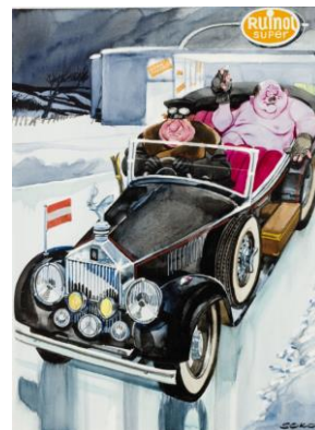
Erich Sokol, Immer höhere Benzinpreise - Und wenn der Liter einen Gulden kost' - lieber versetzt der Österreicher sein Gwand, als aufs Wagerl zu verzichten ..., 1980

Kuratorinnen: Jutta M. Pichler, Anna Steinmair