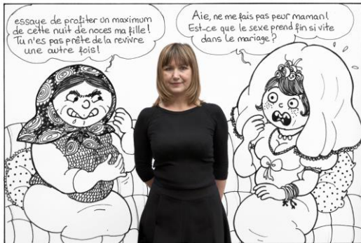
Ramize Erer, Mother's advice, 2010 © Ramize Erer