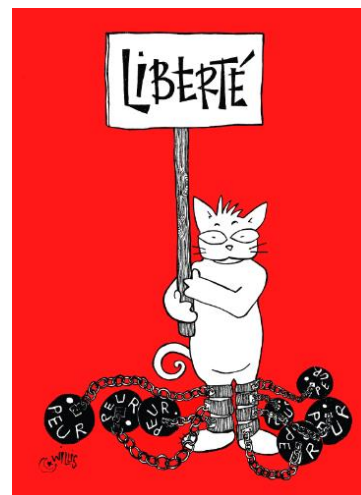
Nadia Khiari, Freedom vs fears, 2015 © Nadia Khiari