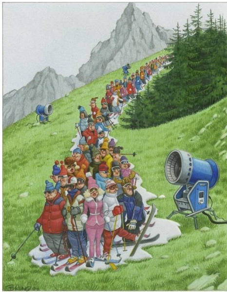
Credit: Bruno Haberzettl, Eröffnung der Skisaison , 2014 © Bruno Haberzettl, Krone bunt