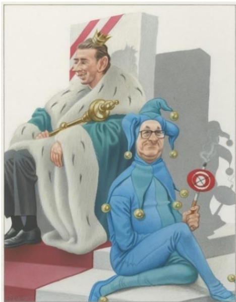
Credit: Bruno Haberzettl, Schön langsam findet sich jeder in seine neue Rolle ein . . . , 2018 © Bruno Haberzettl, Krone bunt